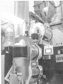
最新鋭設備で無洗米を生産

無洗米の生産は、米の精製工程で、米粒の表面を洗剤で洗った後、米粒の表面を乾燥させることで、米粒の表面の汚れを除去する。従来の無洗米は、米粒の表面を洗剤で洗った後、米粒の表面を乾燥させることで、米粒の表面の汚れを除去する。最新の設備は、米粒の表面を洗剤で洗った後、米粒の表面を乾燥させることで、米粒の表面の汚れを除去する。